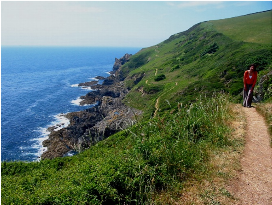
Küste bei Brixham

Devon zählt zu meinen Lieblingsgrafschaften, vielleicht weil ich dort in den 90er Jahren ein Jahr gelebt habe. Diese Grafschaft ist lieblicher und sanfter als das daran anschließende Cornwall, grüne Hügel & rote Erde, das mystische Dartmoor, hübsche Ortschaften und unglaubliche Küstenlandschaft bestimmen das Bild.